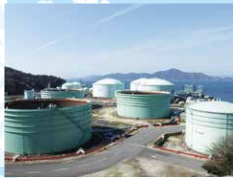
波方ターミナル(株)