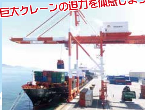
今治港富田ふ頭コンテナターミナル [協力/日本通運(株)今治事業所]