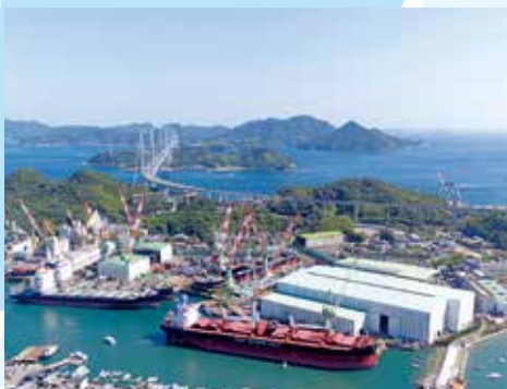
今治造船(株)今治工場